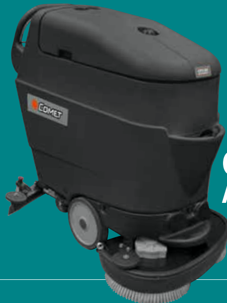
CPS 55/65 ADVANCE