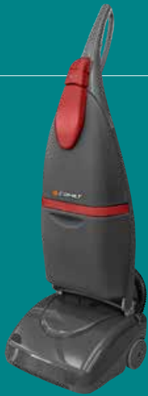
CPS 29 EH