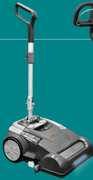
CPS 35 BX Li