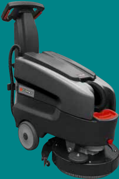
CPS 36 ADVANCE