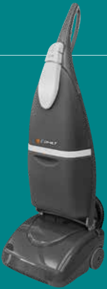
CPS 29 E